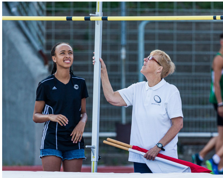
Ein genauer Blick ist gefragt!