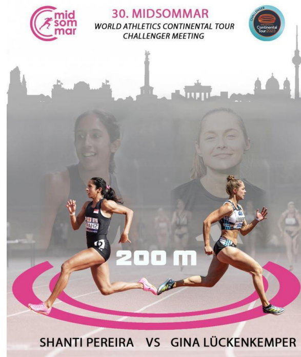
SHANTI PEREIRA VS GINA LÜCKENKEMPER

In den vergangenen Wochen wurden die Anmeldinformationen für den Berliner Straßenlauf – Die Generalprobe (17.7.) und den BMW BERLIN MARATHON (25.7.) an die SCC-Mitglieder versendet. Anmeldeschluss für die Generalprobe ist der 18. August und für den Marathon der 24. August.