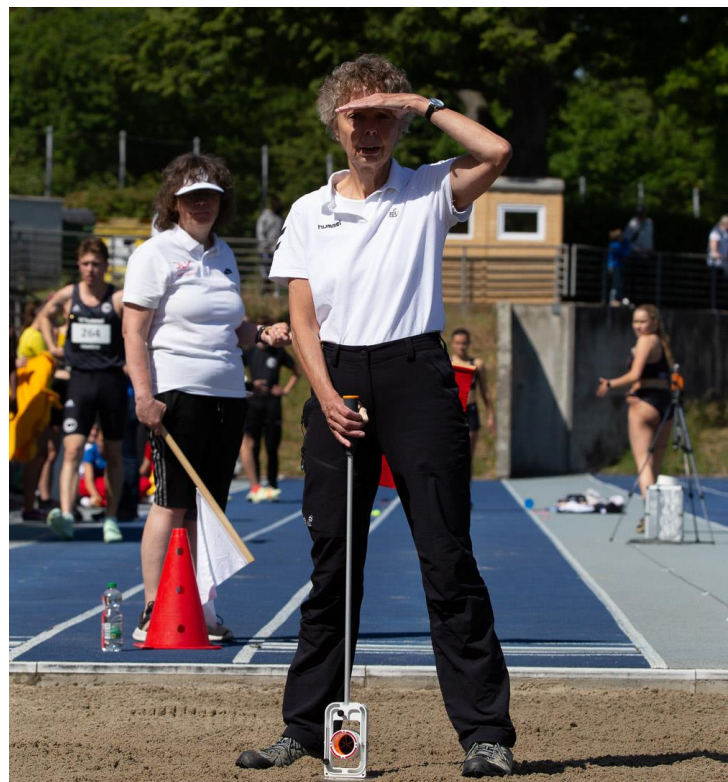
Kampfrichter gesucht

Interessenten und Interessentinnen können sich gern an Sandra Bunk wenden, die auch Fragen zur Kampfrichtertätigkeit beantworten kann.